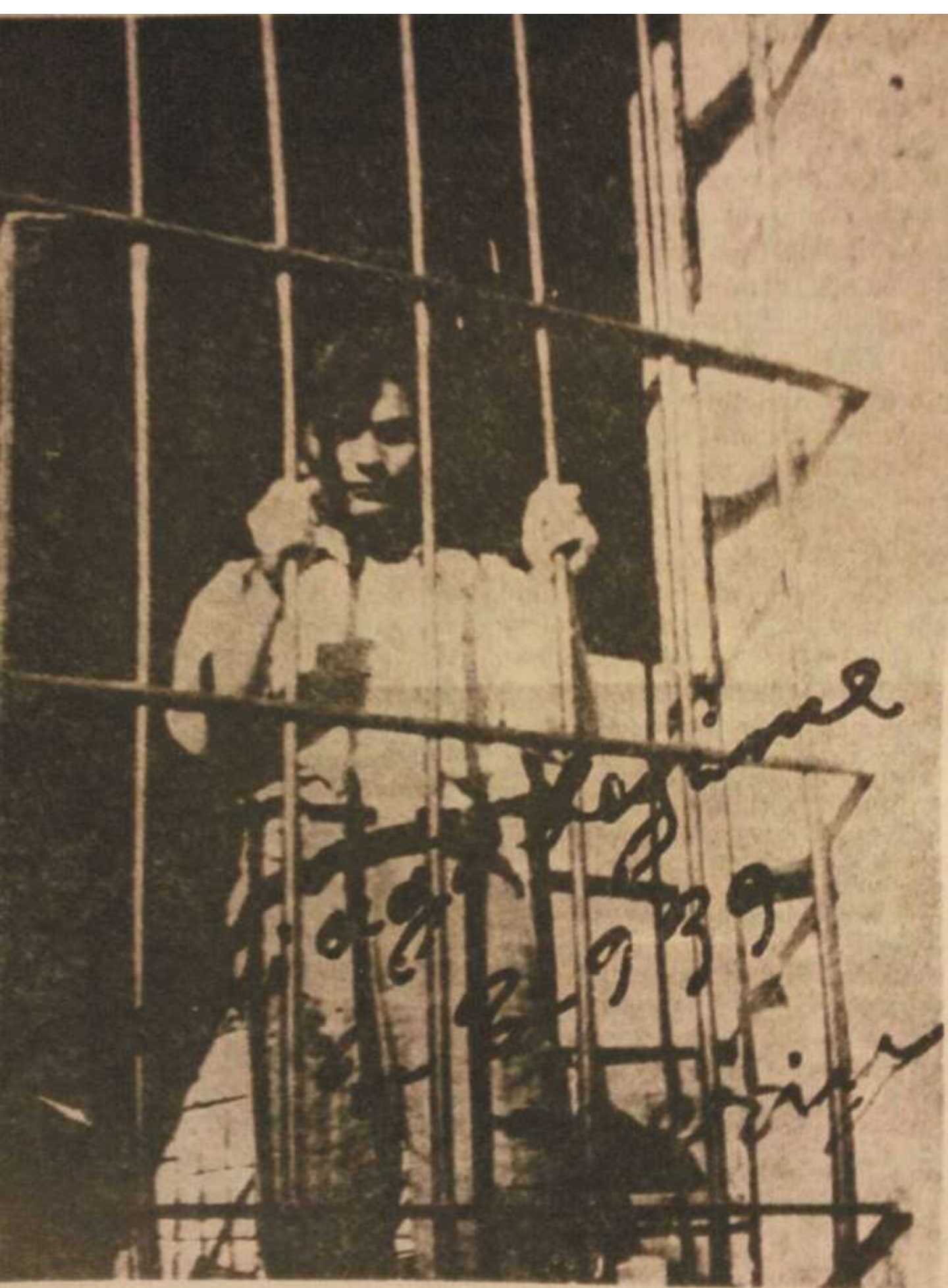
Ferit Korean Sinop Mahpusanesinde